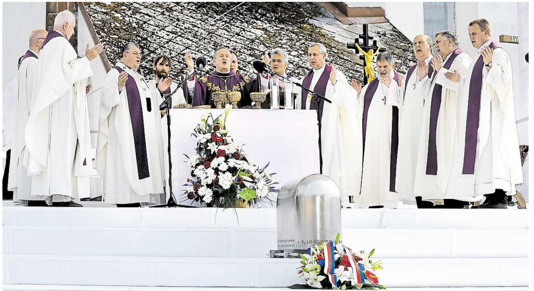
Slavnost připomínající památku Josefa Toufara vyvrcholila mší. V závěru obřadu byla kovová schránka s ostatky kněze uložena do hrobu v čihošťském kostele Nanebevzetí Panny Marie.