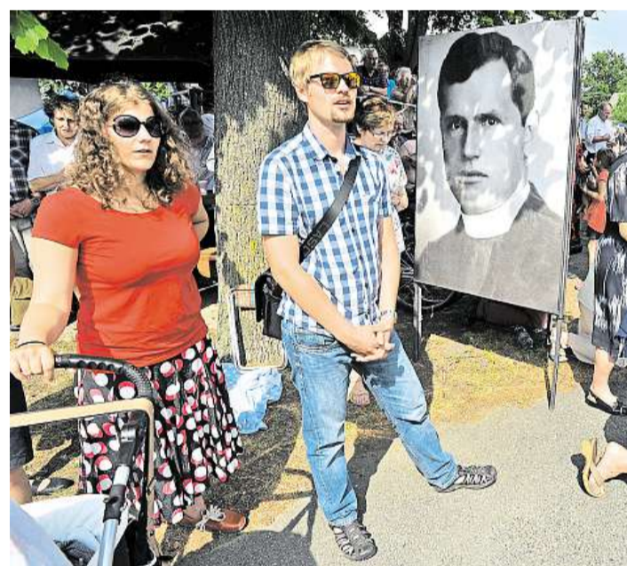
V Čihošti se sešlo několik tisíc lidí. Mši sledovali i na dvou velkoplošných obrazovkách. Jeden autobus přivezl poutníky až z Polska.

S takovými slovy bez zaváhání souhlasí i Tomáš Fiala. Když se současný čihošťský kazatel před necelým rokem dozvěděl, že zamíří právě do Čihošti, nevěděl prý, do čeho vlastně jde, a cítil