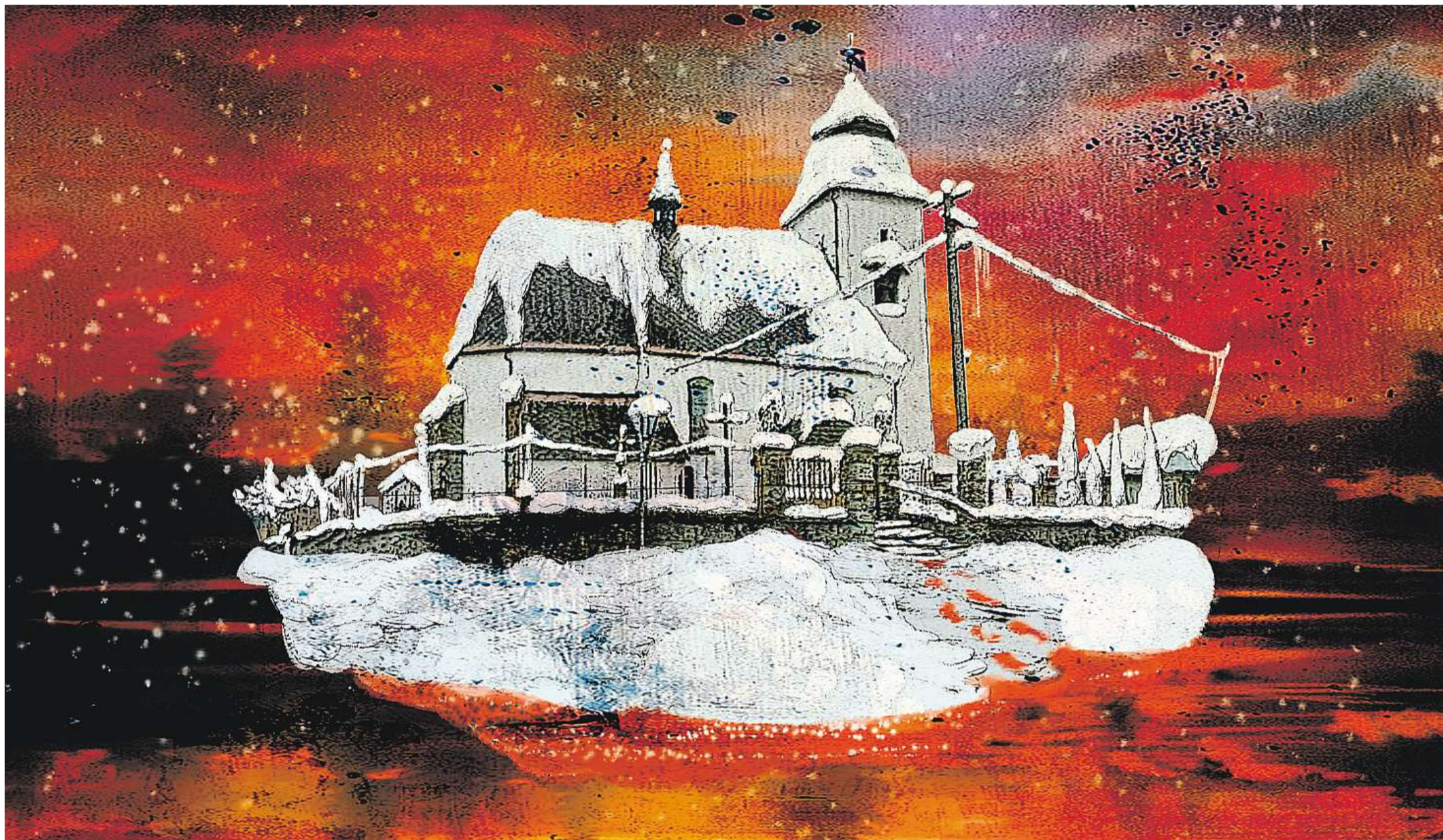
KRESBA LELA GEISLEROVÁ